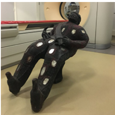
Etudes d'anthropologie sociale